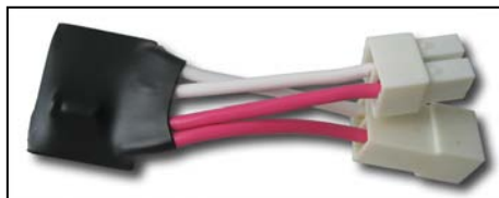
Рисунок 1. Регулятор пуска вентилятора РПВ

4.1 Регулятор рис. 1 представляет собой электронное устройство состоящее из управляющего микроконтроллера и цепи регулирования нагрузки. Микроконтроллер по заданной программе плавно включает нагрузку.