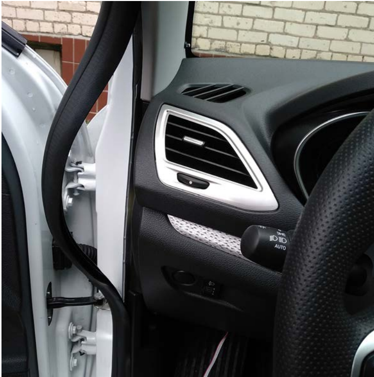
Фото 05 - найдите диагностическую колодку ОВД-II автомобиля, она находится слева, внизу, возле рычага открытия капота