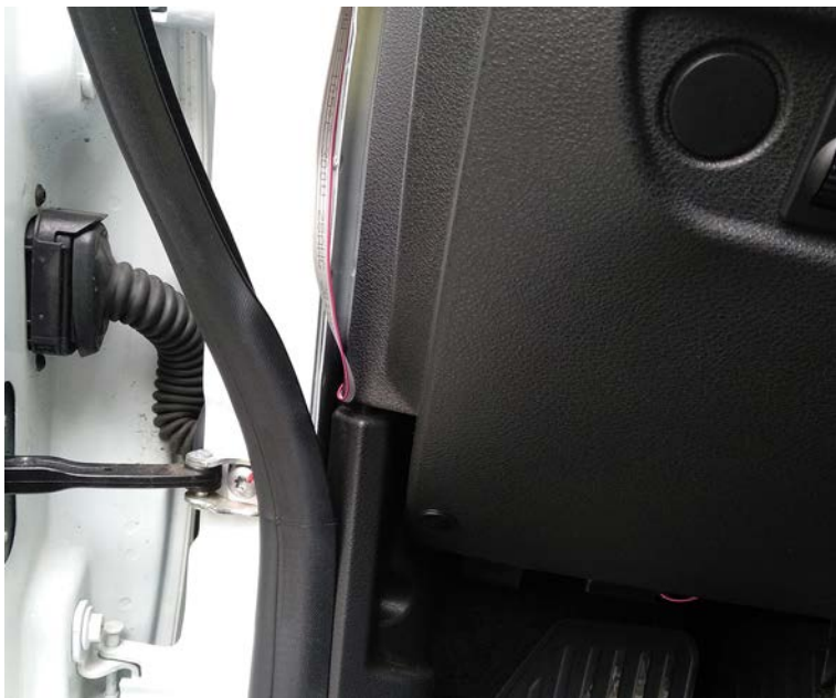
Фото 07 - снимите защитную пленку с крепления МК-1, рекомендуемое расположение МК-1 показано на фото

Фото 06 - проложите шлейф в зазор между уплотнителем и стойкой автомобиля, оставив необходимую длину шлейфа для подключения к колодке ОБД II