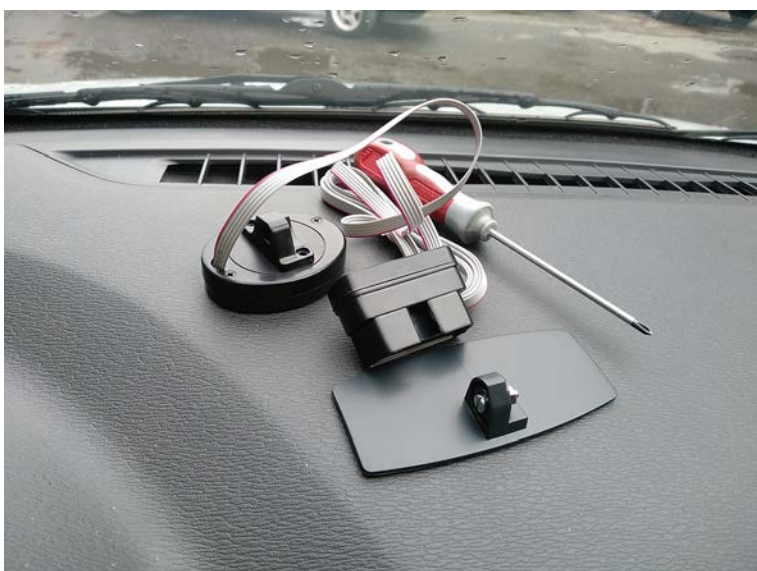
Фото 02 - извлеките МК-1 из упаковки