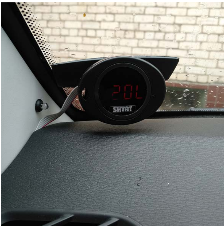
Фото 11 - отображение уровня топлива

После подключения к диагностическому разъему МК-1, на индикаторе МК-1 появятся данные о температуре двигателя, после очередного нажатия скорости автомобиля, и т.д. подробнее смотрите Руководство по установке и эксплуатации