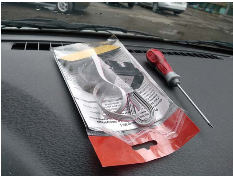
Фото 02 - извлеките МК-1 из упаковки